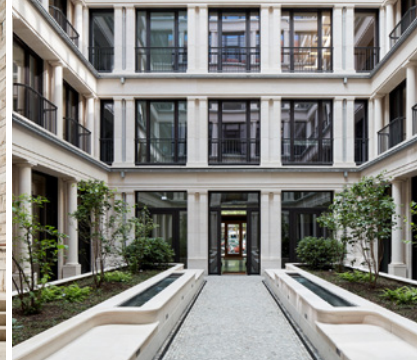
Palais Holler, Berlin Nöfer Gesellschaft von Architekten mbH, Berlin

Die Anmeldung erfasst nachstehende Unterlagen: