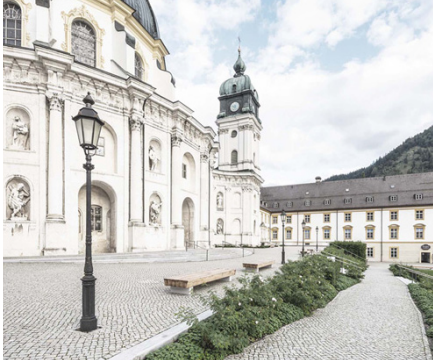
Klosterhof Benedictinerabtei, Ettal w+p Landschaften, Berlin, Offenburg, Schiltach

Mit der Einreichung werden dem DNV die unentgeltlichen Nutzungs- und Veröffentlichungsrechte aller Bilder und sonstigen Darstellungen uneingeschränkt für eigene Veröffentlichungen und Presseartikel übertragen.