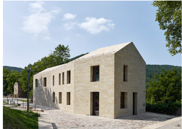
Besucherhaus Hambacher Schloss, Neustadt a.d. Weinstraße; Max Dudler, Berlin

In der Kategorie C: Massive Bauteile und Bauen im Bestand werden insbesondere die Gestaltung massiver Steinelemente sowie die Rekonstruktion und Sanierung von Gebäuden aus Naturstein bewertet.