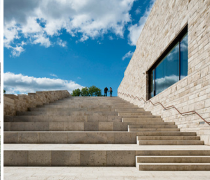
Grimmwelt, Kassel kadawitteldarchitektur, Aachen